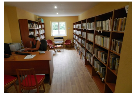
Současný stav obecní knihovny