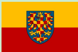
Současná podoba moravské vlajky

Příchod patronů Moravy sv. Cyrila a Metoděje k nám na Moravu byla událost obrovského kulturního a duchovního významu nejen pro naši zem, ale pro značnou část Evropy. Na počest této události bude na našem obecním úřadě vyvěšena moravská vlajka, která je v současnosti také vnímána jako symbol souměřitelnosti občanů k území Moravy, jejího duchovního a společenského života.