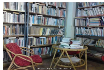
Původní stav obecní knihovny

Otevírací doba zůstává stejná, a to vždy v úterý od 17.00 do 19.00 hodin a v sobotu od 13.00 do 17.00 hodin. Vybrat můžete z mnoha titulů i žánrů. Věříme, že zrekonstruovaná knihovna přiláká nové čtenáře a stávající prosíme, aby nezapomínali vracet vypůjčené knihy včas. Výpůjční lhůta pro knihy vypůjčené mimo knihovnu je 30 dnů. Tuto lhůtu je možné prodloužit dvakrát, nejdéle však na 90 dnů a o prodloužení je nutné předem požádat před uplynutím výpůjční lhůty! Všechny další potřebné informace najdete v Knihovním řádu, který naleznete i na webových stránkách naší knihovny. Ve vestibulu obecního úřadu se také nezapomeňte zastavit u regálu s vyřazenými knižkami, které si můžete rozestat a odnést domů.