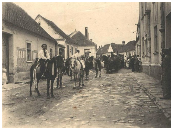
Jedna ze zapůjčených fotografií, která zachycuje hody.

Jak jste si již mohli všimnout, na obecních stránkách se nám podařilo zpřístupnit doslovný přepis kroniky obce Hnanice, kterou psal v letech 1949—1957 obecní kronikář Josef Oliva. Nejen kroniky, ale i fotografie poskytují svědectví o době, ve které vznikly. Proto jsme se rozhodli uspořádat sbírku historických fotografií, které zachycují naši obec v průběhu let. Pokud máte i Vy doma staré fotografie, které souvisí s kulturním děním v obci, zachycují původní vzhled Hnanic nebo jsou něčím zajímavé, prosíme Vás o jejich zapůjčení. Jistě si i vy rádi prohlédnete sbírku fotografií, nad nimiž si budete moci zavzpomínat nebo se jen podívat, jakými proměnami obec prošla. Fotografie budou na-